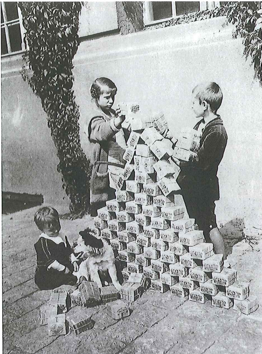
Wertlose Banknoten nach der Währungsreform 1923: „Geschichte voller Lug und Trug“

tenbanken ihre Notprogramme zurückfahren und die Liquidität wieder einsammeln. Das ist eine Sache von einer Woche.