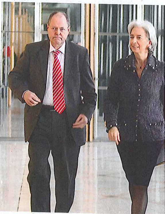
Minister Steinbrück, Lagarde: Mühen der Ebene

Die Kommission hat erste Vorschläge gemacht, das Parlament ein erstes Gesetz beschlossen: Großkredite unter Banken werden künftig auf 25 Prozent des Eigenkapitals limitiert. Und von den riskanten Papieren, die eine Bank dann verkauft, muss sie mindestens fünf Prozent selbst behalten.