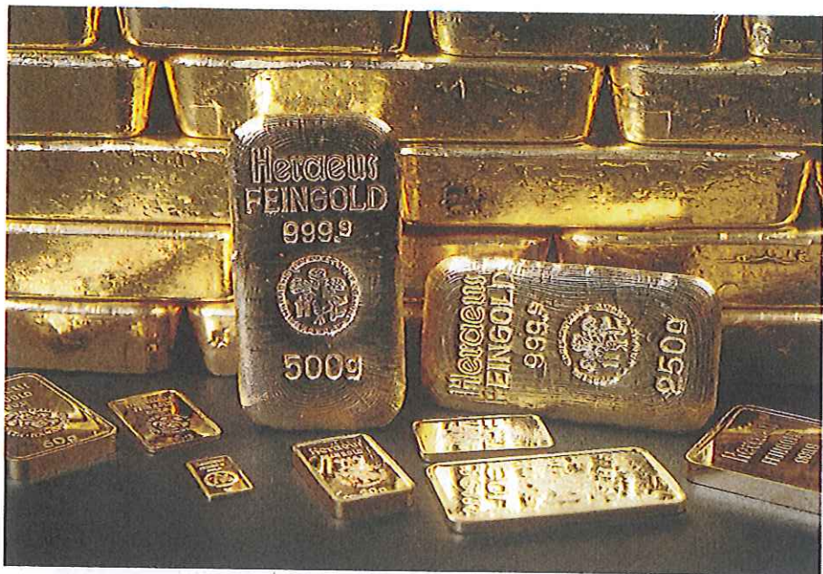
Anlageform Goldbarren: „Die beste Versicherung gegen staatliche Willkür“