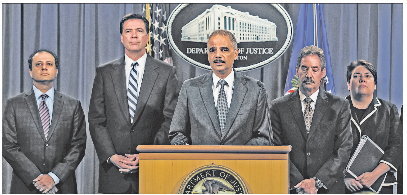
US-Generalbundesanwalt Eric Holder, Entourage (Juli 2014): Bekanntgabe der Rekordstrafe der US-Geschichte – gegen BNP Paribas