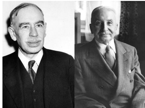
John Maynard Keynes (1883 – 1946)

Hayek folgt Mises in diesem Punkt nicht. Seine wissenschaftliche Methode lässt sich als radikaler Subjektivismus bezeichnen – und damit übt Hayek quasi den Schulterchluss mit der wissenschaftlichen Methode, die die Hauptstrom-Volkswirte vertreten. 2